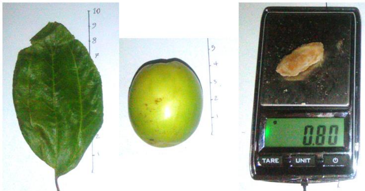
شکل ۱- شکل میوه، برگ و اندازه هسته ژنوتیپ کنار رودان ۱