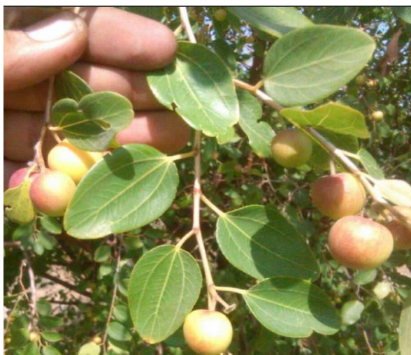
شکل ۲- میوه و برگ ژنوتیپ کنار بدون هسته میناب